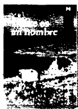
'Este es mi nombre' ADONIS Abarca Editorial

● Los tres poemarios del vate sirio libanés en un sólo libro. Con técnicas surrealistas e innovaciones formales, Adonis reinterpreta toda la historia árabe en clave actual, escatimar la crítica y el gesto ideológico.