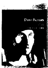
'Seisenta relatos' DINO BUZZATI Acanalitado / Quaderns Crema

● El maestro de las distancias cortas admirado por Calvino seleccionó en 1958 estos relatos. Un mosaico de postales sobre el terror de las ciudades, los automatismos de la vida cotidiana y la irrupción de lo maravilloso.