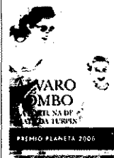
'La fortuna de Matilda Turpin' ÁLVARO POMBO Planeta

● Provocador y agudo como siempre, el escritor santanderino desgrana rencores, hipocresías y equívocos de una familia, cuya ambiciosa madre ha muerto de cáncer, para dar forma a una soberbia novela coral.