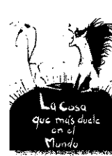
'La cosa que más duele en el mundo' PACO LIVÁN Y ROGER OLMOS Editora OGD