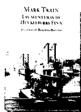
'Las aventuras de Huckleberry Finn' MARK TWAIN Mondadori

● La deriva Misisipi abajo de un chico que huye de un padre alcohólico y un negro fugitivo cumple todos los requisitos del sueño de la gran novela americana. Ahora regresa con un esclarecedor prólogo de Roberto Bolaño.