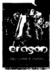
'Eragon' y 'Eldest' CHRISTOPHER PAOLINI Roca Editorial

● El estreno de Eragon en las pantallas realza las virtudes de Paolini, el Tolkien adolescente. Para los pequeños, la versión de Olmos y Liván de la fábula africana de la liebre y la hiena se lleva la palma.