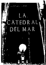
'La catedral del mar' ILDEFONSO FALCONES Grijalbo

● Con más de un millón de ejemplares vendidos sólo en castellano, la ópera prima del abogado Ildefonso Falcones es la revelación del año. Entre novela de iniciación e histórica, sabiamente construida, la obra repasa las aventuras de Arnau, un siervo que logra convertirse en noble, con la construcción de la catedral barcelonesa como telón de fondo.